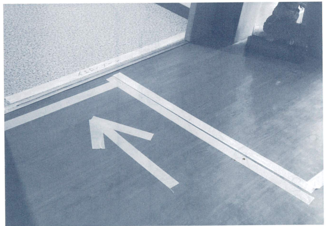
ゾーニングと消毒清掃